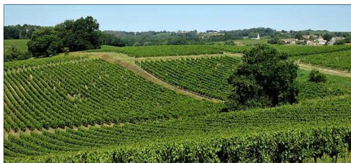
Les vignobles du Blayais