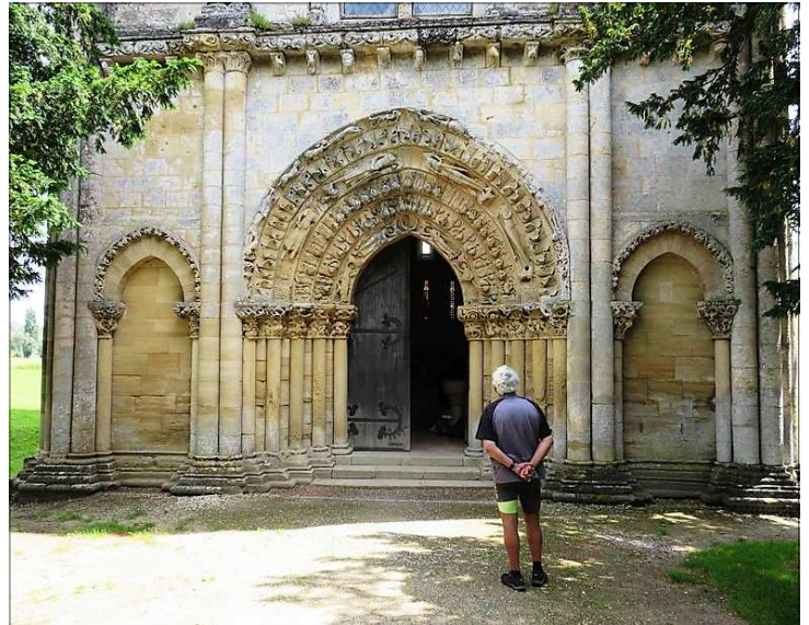
En admiration devant le portail de l'église de Blasimon

Jacques Faizant, Albina et la Bicyclette.