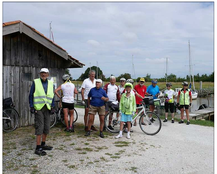
Balade au port de TausSAT