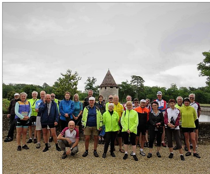
Rencontre avec le CTC de Bristol - visite du château de Labrède