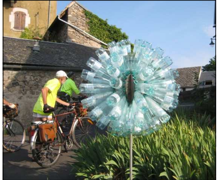
Un monument original à l'eau minérale