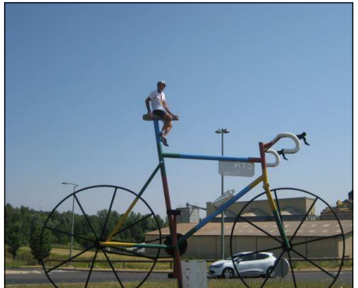
Comment fait-il pour pédaler ?

Jacques Faizant, Albina et la Bicyclette.